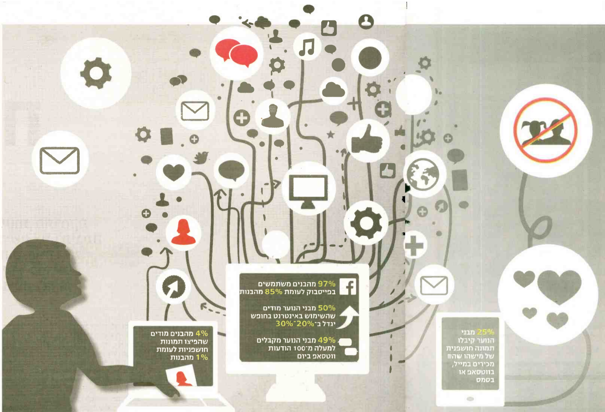
▲ בקלות קורים דברים שיורדים מתחת לרדאר של ההורים. ילדים בחופש ילדים: אינג אימג'

בך, תפנה אלי או אל כל מי שאתה סומך עליו. מעת לעת, לשאול: 'הכל בסדר?' ולגרות את הדיאלוג לאו דווקא בצורה ישירה. בכל מקרה, אסור לוותר או להשאיר את הדברים פתוחים".